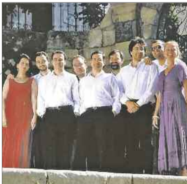
Zarabanda celebra sus 25 años de historia de la mano de Haendel, uno de los grandes del barroco alemán del XVIII

'Antón García Abril' . Las flautas de pico, las guitarras, el laúd renacentista y el canto, fueron los instrumentos empujados en la interpretación de piezas instrumentales del