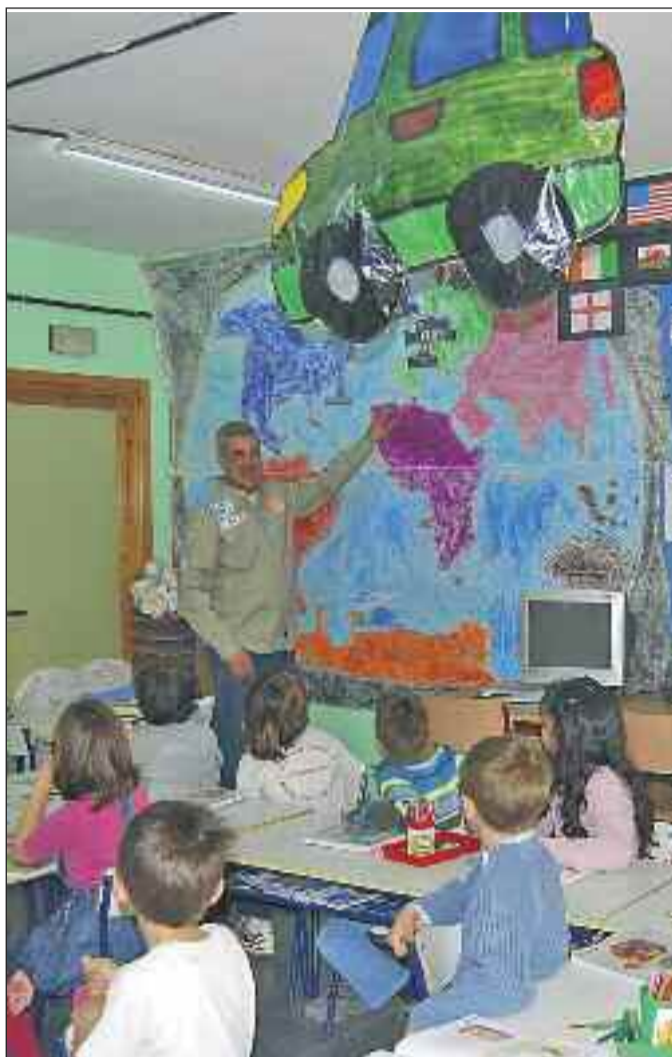
La iniciativa solidaria ha servido para que los escolares conozcan más de cerca Marruecos

La caravana se llevará todo lo que los alumnos de Torreldones donen: cuadernos, lapiceros... materiales muy valiosos para las escuelas de aquel lugar del mundo. La iniciativa cuenta con el apoyo del Ayuntamiento y la Asociación Empresarial de Torreldones.