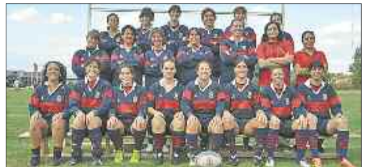
Arriba, las chicas del CR Majadahonda. Abajo: los cadetes del Tasman

Por su parte, el equipo cadete del Club Tasman Rugby Boadilla se ha alzado con el título de campeón de Madrid. Brillante temporada que se ha unido a la consecución del título de Liga (2ª Regional) del combinado senior, por lo que ascienden a Primera. Los infantiles han sido quintos, algo esperanzador de cara al Campeonato de España. ¡Bien hecho, chavales!