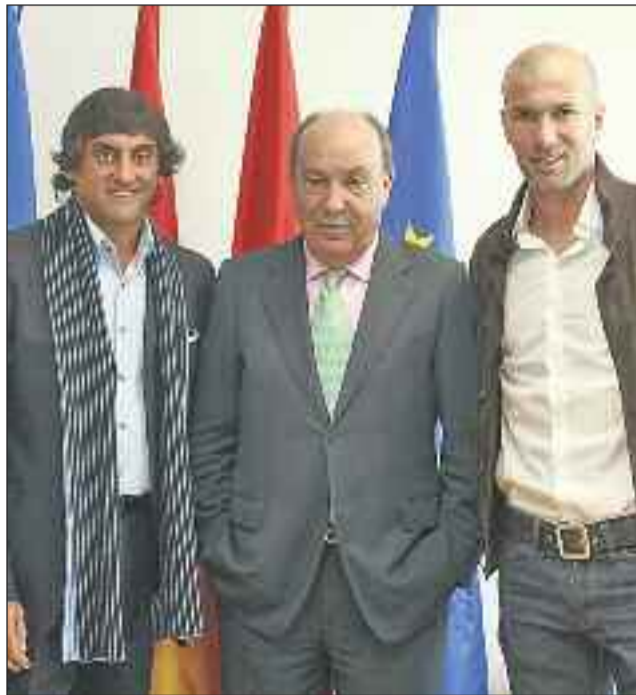
El alcalde roceño junto con los futbolistas Zidane y Francescoli, padrinos de la Academia

Jugar al fútbol siempre ha tenido premio. Los que no llegan a ser grandes figuras de este deporte, tienen como premio un cuerpo que les agradece día a día su buena forma física y decenas de amistades que comparten con ellos el amor por este deporte. Ahora, en Las Rozas se da una razón más para que este deporte siga siendo el rey en los patios del colegio y en las clases extraescolares de cientos de niños y, cada vez más, niñas de los municipios de la Sierra. Acaba de rodar el balón de la nueva Academia de Fútbol apadrinada por el ex jugador del Real Madrid, Zinedine Zidane y por el uruguayo Francescoli, conocido como 'El Príncipe'. Se trata de un concurso para jóvenes talentos que, por un sistema de eliminación, designa a uno de ellos como el mejor talento tanto por sus valores futbolísticos como por sus virtudes personales. Hace unos días comenzaron las pruebas de selección tanto en España como fuera de nuestro país de 50 chicos que se concentrarán en la finca municipal El Pilar. Tras unas