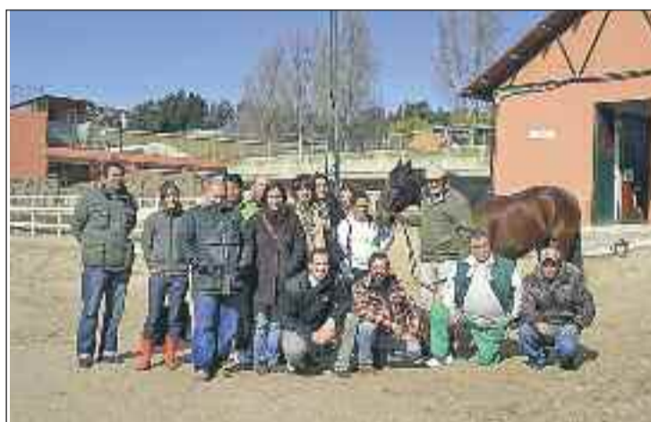
Los alumnos al término del curso estarán capacitados para montar su propio negocio

El Ayuntamiento va a poner en marcha un total de 230 talleres de consumo entre la población escolar del municipio. El objetivo básico de estos talleres es el de difundir el conocimiento de los derechos, deberes e instrumentos de protección del consumidor entre la población más joven para que desde temprana edad los escolares tomen conciencia de sus derechos y obligaciones como consumidores. El Programa Regional de Educación del Consumidor en la Escuela, dependiente de la Comunidad de Madrid adapta los contenidos informativos en materia de consumo a cada tramo de edad. Todos los centros escolares públicos, concertados y privados, así como los Institutos y escuelas infantiles participarán desde finales del mes de marzo y hasta octubre en estos talleres en los que destacan los destinados a la seguridad infantil, aprender a ver anuncios, a leer el etiquetado y sobre reciclaje.