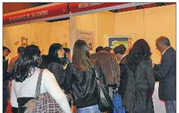
Por el stand pasaron decenas de visitantes

cinco empresas de Boadilla, que actualmente ofertan empleo, estuvieron también presentes en la Feria recogiendo currículum de todas las personas que demandaban trabajo. La edición de este año ha potenciado la presencia de pequeñas y medianas empresas de la región que ofertaban puestos de trabajo en el ámbito de la Formación Profesional, en sectores como electricidad o informática.