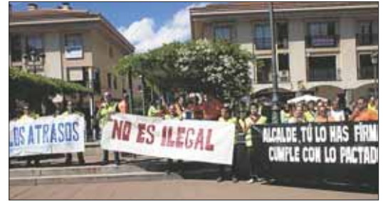
Los trabajadores del ayuntamiento demandan mejoras salariales

La utilización sistemática y periódica del Modelo por parte del equipo directivo, permite a éste el establecimiento de planes de mejora basados en hechos objetivos y la consecución de una visión común sobre las metas a alcanzar y las herramientas a utilizar.