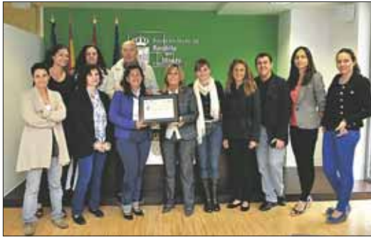
En la imagen, los responsables de cada departamento municipal.