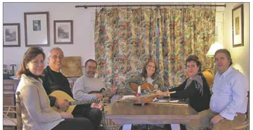
grupo de folk Cigarra

La cita es el viernes 24 de junio a las 22.00 h. en Torreforum