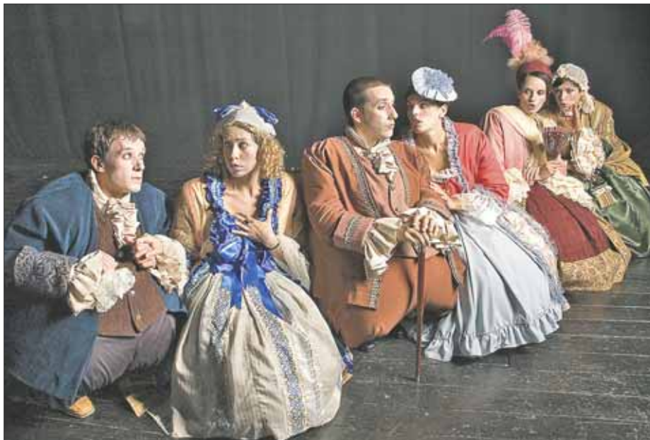
En 'Chafarderías' los actores añaden la dificultad intencionada de pasar la obra completa agachados.