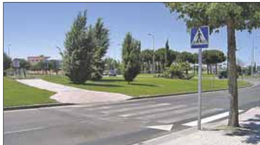
Las aceras hasta la rotonda del centro comercial se han pavimentado y se ha mejorado el alumbrado público.

También se han pintado dos pasos de peatones, pasos que se han indicado con cuatro señales verticales. Asimismo, se han pavimentado 471 metros cuadrados de acera a lo largo de 300 m. de longitud hasta la rotonda de Equinoccio. También se ha mejorado el alumbrado público.