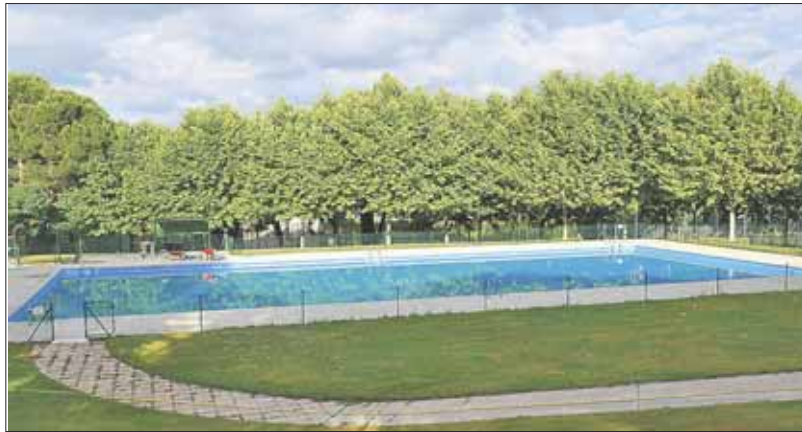
Las piscinas municipales del Noroeste permanecerá abiertas hasta el 11 de septiembre.

'Madrid loco por informarte' es la traducción del lema que da nombre en inglés a esta red informativa, un instrumento más a disposición de la población local dentro de las nuevas acciones a desarrollar por el Consistorio en el área de Turismo, a la que Valdemorillo quiere prestar una especial atención por ser factor clave en la dinamización económica de esta localidad, y en su proyección como referente de futuro.