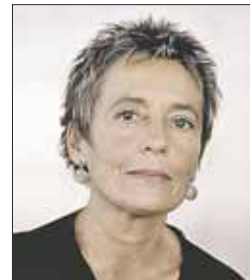
María Joao Pires

también a tres agrupaciones de prestigio internacional que ofrecerán la oportunidad de acercarse a la danza desde diferentes ángulos. Los días 8 y 9 de julio, la Compañía de Blanca Li descubrirá su particular universo en El jardín de las delicias, inspirado en el cuadro de El Bosco, una creación de la coreógrafa granadina para su compañía en la que la poesía y la fantasía se unen para crear un espectáculo de gran belleza y plasticidad.