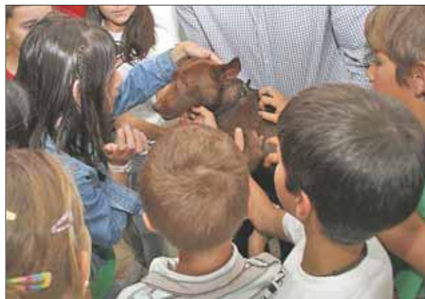
'Chocolate' fue la atracción del curso

los animales de compañía y sus necesidades. Se ha hecho hincapié en aspectos como la necesidad de vacunar y desparasitar cada año al animal, realizar visitas periódicas al veterinario, alimentar de manera adecuada a la mascota o facilitar que haga ejercicio. Igualmente se les ha explicado la necesidad de ser cuidadosos con la higiene y socialmente responsables. Al final de la charla, los escolares tuvieron la oportunidad de ver de cerca y acariciar un perro del Centro de Atención Animal de Las Rozas.