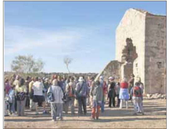
Más de cien personas visitaron el pasado 27 de noviembre la mina

Esta riqueza minera del sur del municipio, contrastada en numerosos textos y estudios, pasa a primer plano en la actualidad tras el descubrimiento de plata en Hiedelaencia (Guadalajara) en 1840. Por estas fechas se desata una pequeña 'fiebre del oro' a la española que convierte Colmenarejo en un destino frecuentado por buscadores. En estos años se dan concesiones a numerosas explotaciones mineras, la mayoría de las cuales