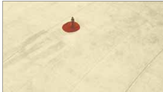
Cyrano de Nueva Orleans, María Pagés, La guerra de los Rose y 'Vocecita', algunas de las propuestas culturales para los próximos días