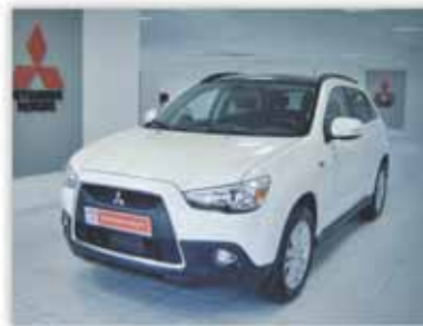
Gama ASX desde 19.000€