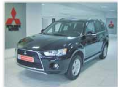
Gama Outlander desde 23.990€

Venta de 35 vehículos seminuevos y Km. 0, totalmente revisados y con garantía de fábrica de hasta 5 años. Sólo del 14 al 17 de diciembre.