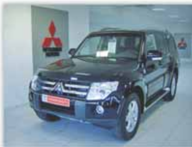
Gama Montero desde 36.500€