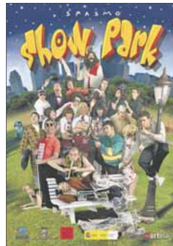
Show Park repasa el mundo cotidiano

Para el 10 de diciembre está prevista la representación de la obra de teatro 'Show Park' (Au-