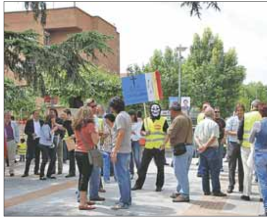
El 17 de mayo los trabajadores se concentraron en la plaza del Ayuntamiento

Los sindicatos aseguran que el mismo documento va a ser "la base de cualquier negociación" con el Gobierno que salga de las urnas. Indican que con quien han negociado es con la institución y no con el Gobierno de Bonifacio de Santiago. "El ayuntamiento está legitimado para que se mantengan los acuerdos adoptados" tras las elecciones. La oposición por su parte no entiende por qué se ha estado negociando el Convenio todos estos años (cerca de