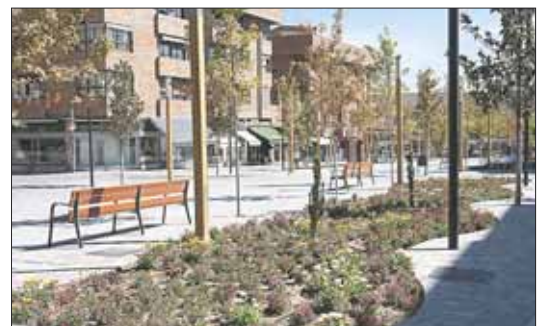
Narciso de Foxá se empeñó en peatonalizar el casco histórico de Majadahonda. Promesa cumplida en varias zonas de la localidad.