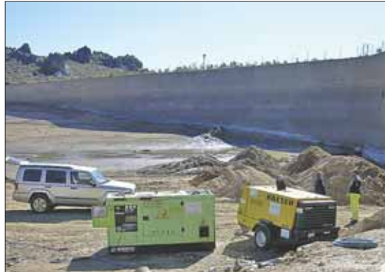
La reparación de la Presa de Majada del Espino fue una de las promesas electorales del Partido Popular que sí se han cumplido.

LAS ROZAS. PP. Creación de un Servicios de Respuesta Rápida para la resolución, en el menor plazo de tiempo, de las inciden-