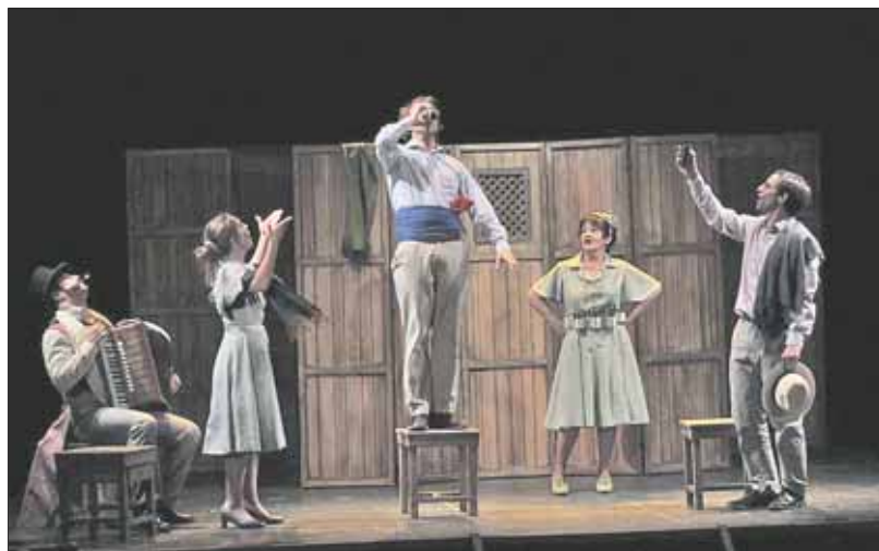
Abrevia-t, sábado 21 en el teatro municipal Las Cigüeñas