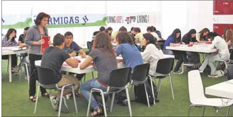
El curso pasado más de 240.000 estudiantes se enfrentaron a la prueba de acceso a la Universidad

Las obras deberán presentarse el 5 de junio en la Plaza de la Constitución, fecha en la que se realizará la exposición y se dará a conocer los ganadores del concurso. La inscripción es gratuita y se realizará a través del correo reciclajeaytorrelorones@gmail.com antes del 2 de junio.