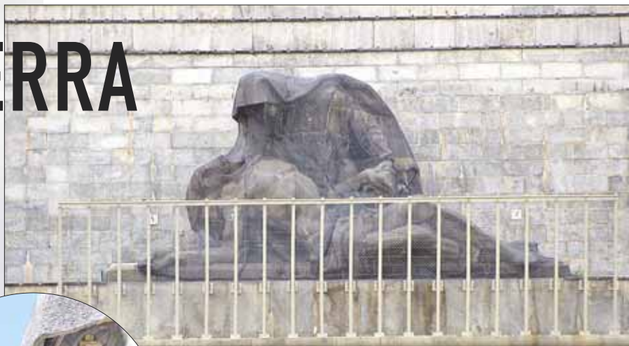
El escultor Juan de Ávalos fue el creador de La Piedad y de Los Evangelistas, las obras de arte más importantes de todo el conjunto artístico del Valle. Ávalos es uno de los grandes escultores del s.XX y hay quien le sitúa a la altura de Miguel Ángel o Rodain.

Carlos Zarco piensa que el Valle debería ser declarado Patrimonio de la UNESCO y esa movilización "debe partir de los pueblos de la Sierra". El Valle de los Caídos ha sido uno de los conjuntos monumentales más visitados de España. Escultores de renombre internacional han investigado la obra escultórica de Juan de Ávalos 'La Piedad', al ser considerada una obra de arte universal. La escultura que preside el frontispicio de la Basílica del Valle sufrió en 2008 la pérdida de una mano del Cristo yacente que obligó a la colocación temporal de una tela metálica para evitar deprendimientos. Posteriormente, y