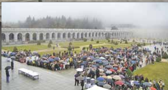
De momento, el Valle permanece cerrado a las visitas pero el acceso a la Basílica es libre en el horario de culto. Asimismo el acceso está permitido para acceder a la hospedería (91 890 55 11).