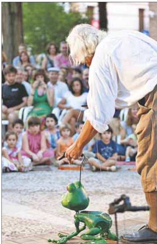
Títeres de Plansjet (Bélgica)

Un gran número de actividades para que los más pequeños no se aburran, no dejen de aprender, y ya que están, les den un respiro a sus progenitores.