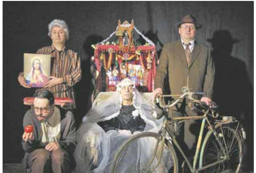
Santa Perpetua, de Producciones Micomición