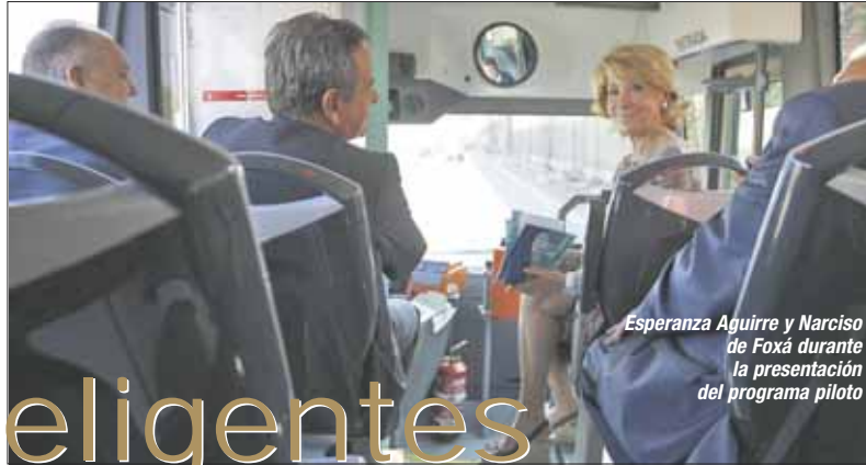
Esperanza Aguirre y Narciso de Foxá durante la presentación del programa piloto

L as paradas de autobús del futuro tendrán pantallas que informarán sobre el tiempo de espera, la duración del viaje o incidencias como averías o atascos. En un futuro, el usuario de este tipo de transporte recibirá