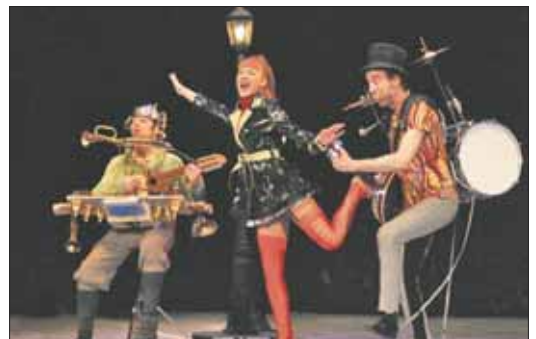
Absurdo ma non troppo, de Teatro de Malta

Lo bueno que tiene el teatro es que todavía no está del todo inventado. No sé si alguien habrá afirmado esto antes, pero a la vista de los dos espectáculos que visitan Collado Villalba y El Escorial no podemos más que reafirmarnos: el teatro nunca dejará de sorprendernos, sobre todo si nos acercamos a él con la inocencia propia de nuestras primeras visitas a un patio de butacas. Es como el que se sienta frente a un hipnotizador: si no quiere, no habrá manera... O sí.