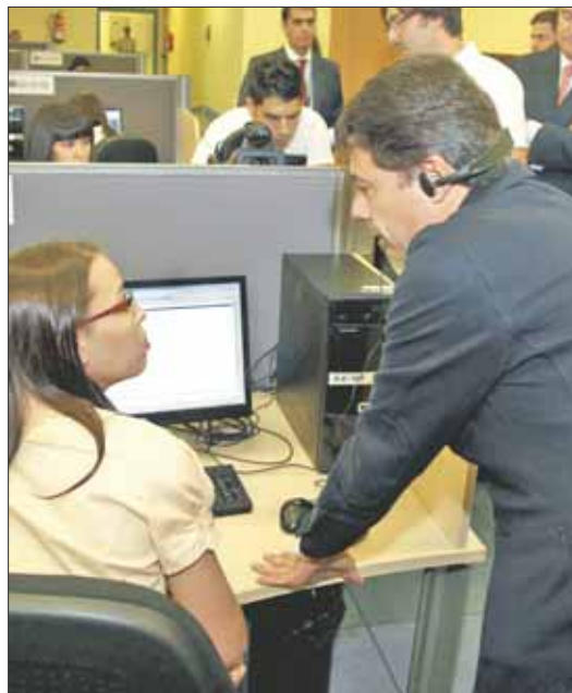
El vicepresidente de la Comunidad de Madrid ha comprobado la evolución que está experimentando este servicio de información

Desde la puesta en marcha del servicio 012, se han realizado cerca de 10.000 renovaciones. La media de llamadas diarias es de 9.000 y, respecto al perfil de los usuarios, el 68% son mujeres, un 38% tiene entre 30 y 44 años y el 61% llama desde la capital.