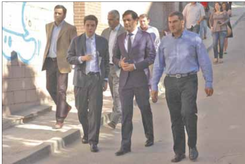
Las obras de Pradillo Herrero han sido costeadas por el Gobierno regional

aguas naturales y las depuradas, recogiendo muestras en las Estaciones Depuradoras de Aguas Residuales (EDAR), y en distintos puntos de los cauces que atraviesan el territorio. Además se detectarán vertidos en los aliviaderos y colectores de la red municipal. Una vez detectados los problemas de roturas, atascos o vertidos, se solucionarán las deficiencias. Estos trabajos están a punto de empezar en la estación de bombeo de Valle del Roncal, que resolverá los problemas por captación de vertidos desde El Pinar hasta La Marazuela y que tantos olores provoca para el malestar de los vecinos.