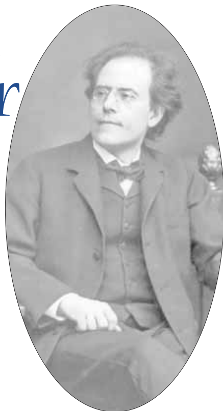
Gustav Mahler en una imagen de 1909

Obra de culto, fuente de valores positivos sobre el individuo y la sociedad.