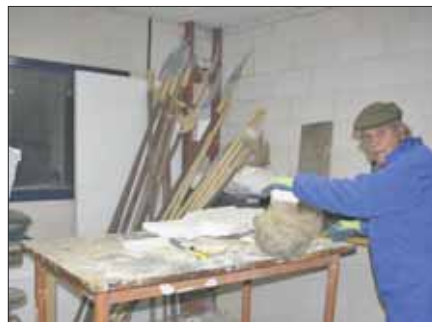
De manera altruista, todas las tardes, desde mediados de octubre hasta diciembre, hombres y mujeres, visten y arreglan las figuras que se han deteriorado el año anterior.

Y además, y no son pocos, las figuras humanas lucirán vestidos nuevos, aquellos que con mimo les colocan las vecinas del pueblo. Mantas, sábanas, y telas donadas por el resto de vecinos. Porque, ya se sabe, en este belén, todos arriman el hombro.