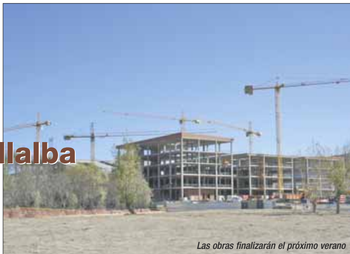
Las obras finalizarán el próximo verano

En el área médica contará, entre otros, con servicios de Pediatría, Oncología Médica y Cardiología, mientras que en el área quirúrgica dispondrá de servicios de cirugía pediátrica, angiología y cirugía vascular.