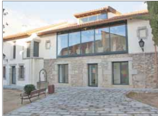
Fachada del edificio que albergará diferentes actos culturales así como muestras del legado del literato