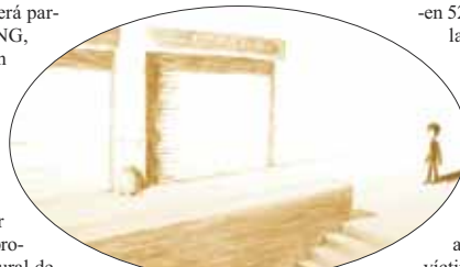
Una de animación: 'Mi vida en tus manos'

Esperamos que su visita al Festival sirva para cambiar... a mejor su visión de los estratos sociales menos favorecidos. Espectáculo y concienciación: dos por uno.