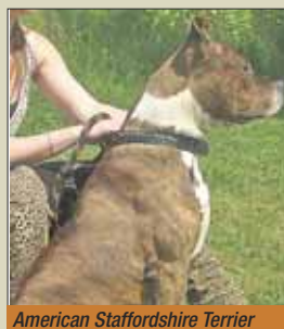
American Staffordshire Terrier