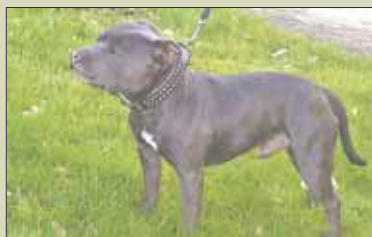
Staffordshire Bull Terrier