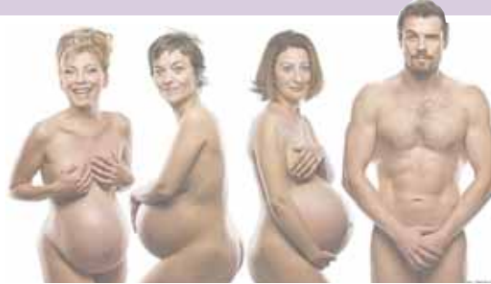
Los protagonistas de 'Tres'

Los puntos de referencia del Festival son el Ayuntamiento, el Castillo de los Mendoza, el centro Vicente Ferrer, la Casa de la Cultura, la Casa Roja y la biblioteca municipal. Atentos al programa.