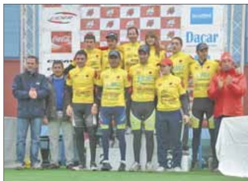
Podio de la Copa de Madrid 2009 - 2010

Ciclista Escorialense, y todos esperamos que el presente año sirva para mejorar el medallero en el Campeonato de España, aunque la crisis ha hecho mella: los premios serán de menor cuantía y la organización cobrará cinco euros a los corredores senior y master. Eso sí, habrá nueva imagen, porque se utilizarán las vallas, arco de meta y trasera de podio de la Vuelta a Madrid profesional, lo que "mejorará la seguridad de los corredores".