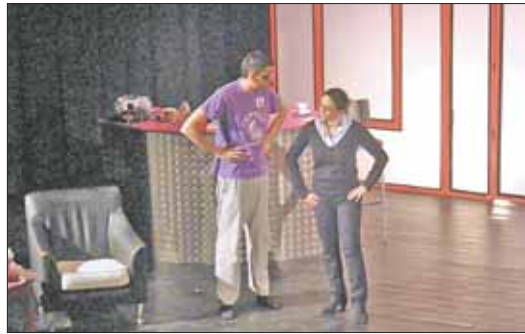
Ya van 30

de premios, con la actuación de los cómicos 'locales' COVAL.