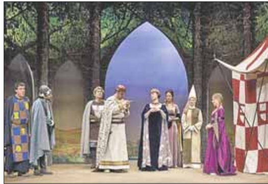
La Venganza de Don Mendo

El 30 de octubre tendrá lugar la ceremonia de clausura y entrega