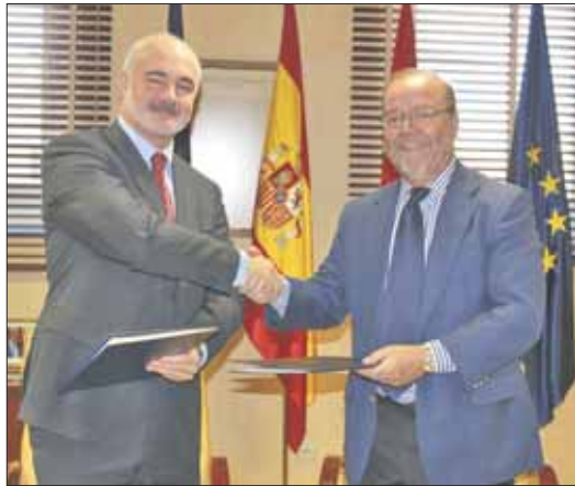
El alcalde y el presidente de la Asociación en el momento de la firma

El 11 de octubre esta marcado en el calendario escolar como el primer Día sin cole (a excepción de las fiestas locales). De nuevo los municipios del noroeste se movilizan para facilitar a sus vecinos el poder conciliar su vida laboral y familiar. En Collado Villalba el colegio E.Tierno Galván abre sus puertas en horario ampliado. En total se ofertan 40 plazas. En Majadahonda el CEIP San Pío la jornada comenzará a partir de las 09:30h., aunque existe un servicio de acogida opcional una hora y media antes. Las Rozas oferta por su parte 150 plazas para niños de entre 3 y 14 años y ocho plazas más para niños de 5 a 16 años con necesidades educativas especiales. La Mancomunidad THAM abre el colegio Nuestra Señora de Lourdes en Torrelorones . El precio por niño es de 9 euros y de 14,59 euros con comedor. Existen descuentos en función de hermanos participantes. Y en Villanueva de la Cañada se ofertan 50 plazas en el colegio María Moliner. El programa no incluye servicio de comedor, por lo que los niños deberán llevar su comida de casa.