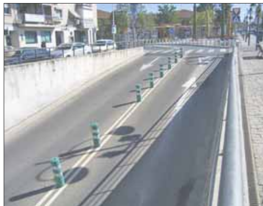
El túnel atraviesa el centro del municipio

sentido contrario. La entrada al túnel se efectúa en la Avenida Reyes Católicos dirección Plaza de Colón, donde tiene la salida tanto del aparcamiento como del propio túnel. Las entradas al parking de Gran Vía-Jardinillos permanecen sin cambios.