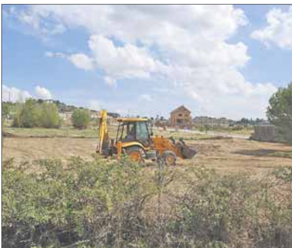
Los trabajos han comenzado con el desbroce del terreno y la excavación de terraplenes.

El skateboarding es un deporte que se practica al aire libre. Quién no ha visto nunca patinar a los chavales sobre una tabla en las aceras de su barrio. Pero los que lo practican se ven limitados por los baches o badenes que pueden desestabilizarlos y los que lo padecen se quejan de los posibles encontronazos que tienen con ellos con los consiguientes accidentes. En Torrelorones, donde hay una gran afición, no sólo a este deporte sino al patinaje en general, lo han tenido en cuenta y ya han comenzado las obras de unas pistas en Pradogrande donde poder disfrutar del skate sin limitaciones y con seguridad. El proyecto con cargo al Plan Prisma de la Comunidad se ubicará junto al antiguo minigolf. Contará con plataformas elevadas, rampas con pendientes de hasta el 20 %, bancada elevada y planos inclinados. Toda la zona se acondicionará con jardines y mobiliario urbano.