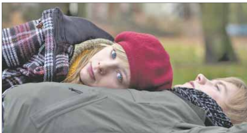
Fotograma del filme 'Mi sasha'