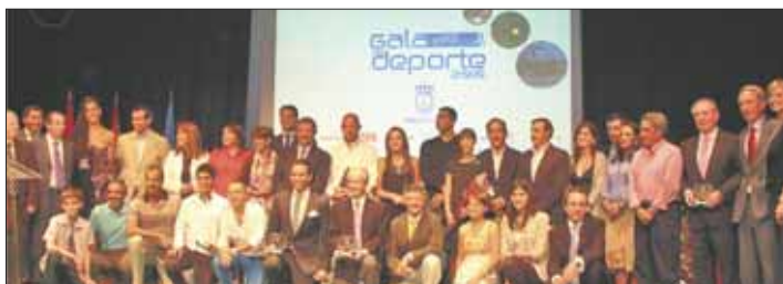
Arriba: Gala del Deporte de Villanueva de la Cañada

Muy cerca de allí, en el Auditorio Teresa Ber-