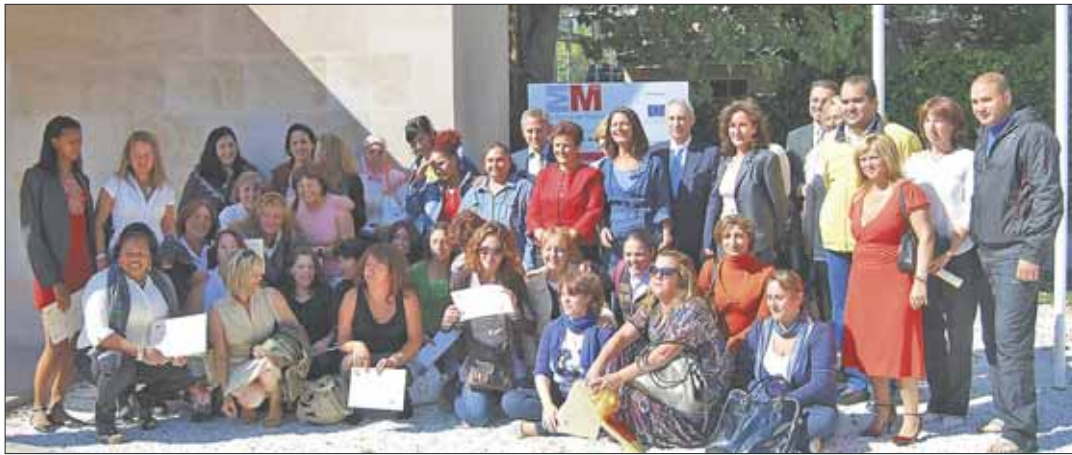
La consejera junto con alcaldes del THAM y alumnos del taller