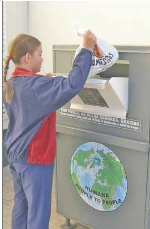
Los contenedores de ropa están instalados también en algunos organismos oficiales y en colegios como El Cantizal de Las Rozas, donde los niños depositan la ropa que les va quedando pequeña.

Esta ONG trabaja desde 1987 con el doble objetivo de realizar proyectos de cooperación a través de la gestión eficaz de las donaciones de ropa usada. La sede central se encuentra en Barcelona