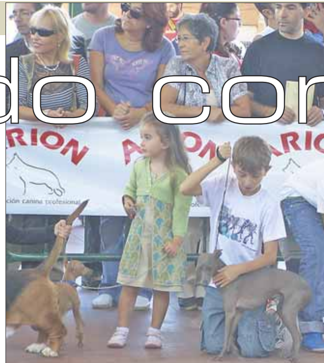
Los niños son los mejores amigos de los perros. Por ello, tanto unos como otros, en el noroeste de la región las mascotas caninas son habituales en los hogares y en los municipios como Torrelodones o los concursos de perros como el celebrado en el centro específico. Una vez que el juzgado se pronuncie el perro podrá o no volver con su dueño.

Lo primero que tenemos que hacer si nos muerde un perro y hay herida es ir al médico para que éste haga un parte de lesiones. Después hay que acudir a la Policía Local o a la Guardia Civil para el atestado y finalmente solicitar al juzgado daños y perjuicios. El atestado ha de ser notificado también al Ayuntamiento donde se ha producido la agresión para que el perro sea vigilado durante 14 días por si tuviera rabia, aunque esta enfermedad "es poco probable que la padezca debido a la vacunación tan exhaustiva que hay hoy en día, pero es una exigencia de la Organización Mundial de la Salud" asegura Javier Gavela, veterinario municipal de Las Rozas. La vigilancia puede ser en casa o